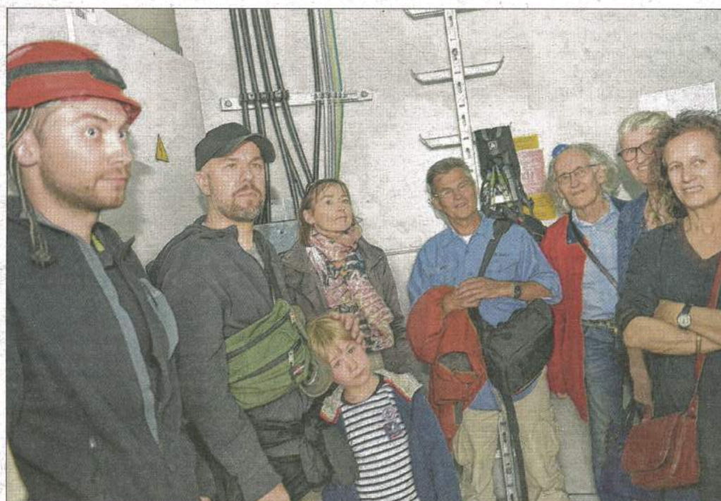
Le public a pu découvrir l'intérieur d'une des éoliennes.

► Renseignements : contact@ailesdescretes.com et www.enercoop-ardennes-champagne.fr