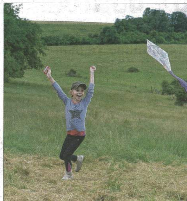
Éole, le maître des vents, étant à l'honneur, les cerfs-volants étaient

Le premier parc éolien citoyen régional vient d'être inauguré à Chagny. Avec trois éoliennes, dont celle des enfants, pour laquelle il est encore possible d'investir.