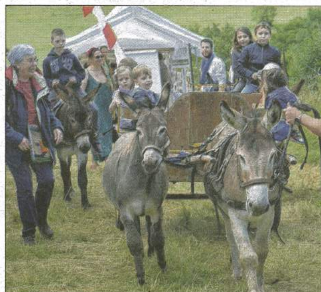
Une journée festive et conviviale pour l'inauguration des trois éoliennes.